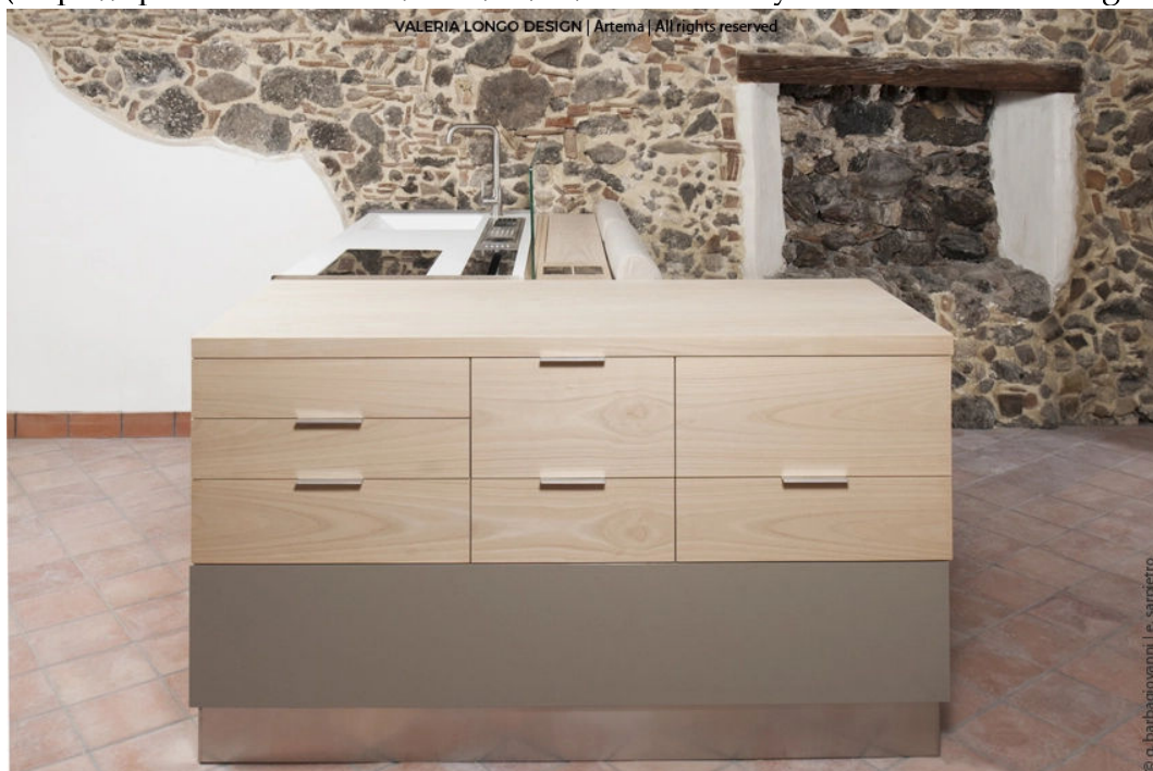
( https://spazioartema.com/2017/03/29/salina-arredo-multifunzionale/attachment/6/ )