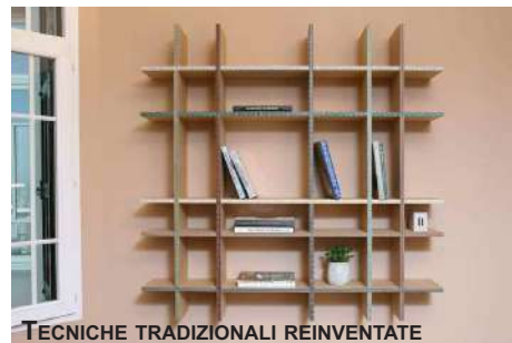
TECNICHE TRADIZIONALI REINVENTATE