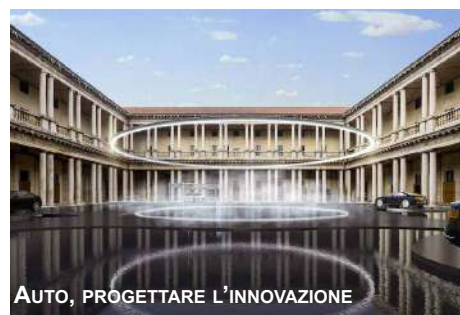
AUTO, PROGETTARE L'INNOVAZIONE