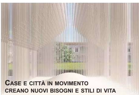
CASE E CITTÀ IN MOVIMENTO CREANO NUOVI BISOGNI E STILI DI VITA