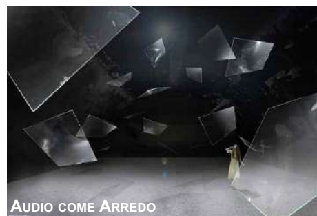
AUDIO COME ARREDO