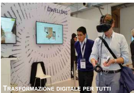
TRASFORMAZIONE DIGITALE PER TUTTI