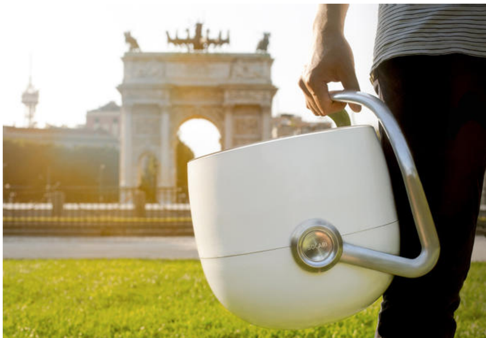
Foto: la cucina portatile Solar Project di Hon Bodin al BASE per Design Nomade