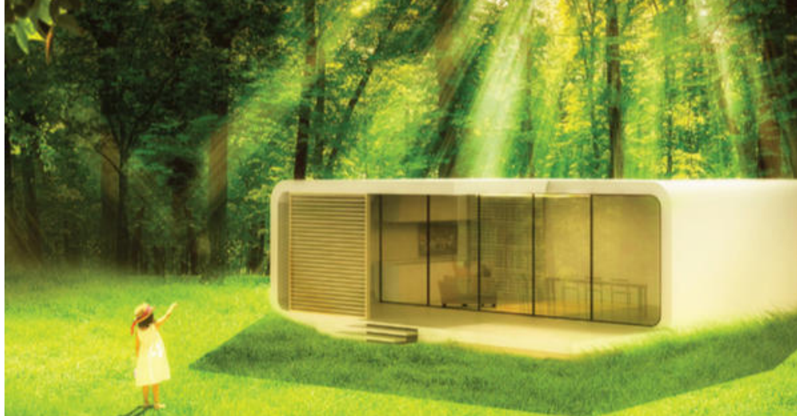
Foto: al BASE per Manifattura 4.0, anche Green Smart Living, il modulo abitativo di Massimiliano Mandalini