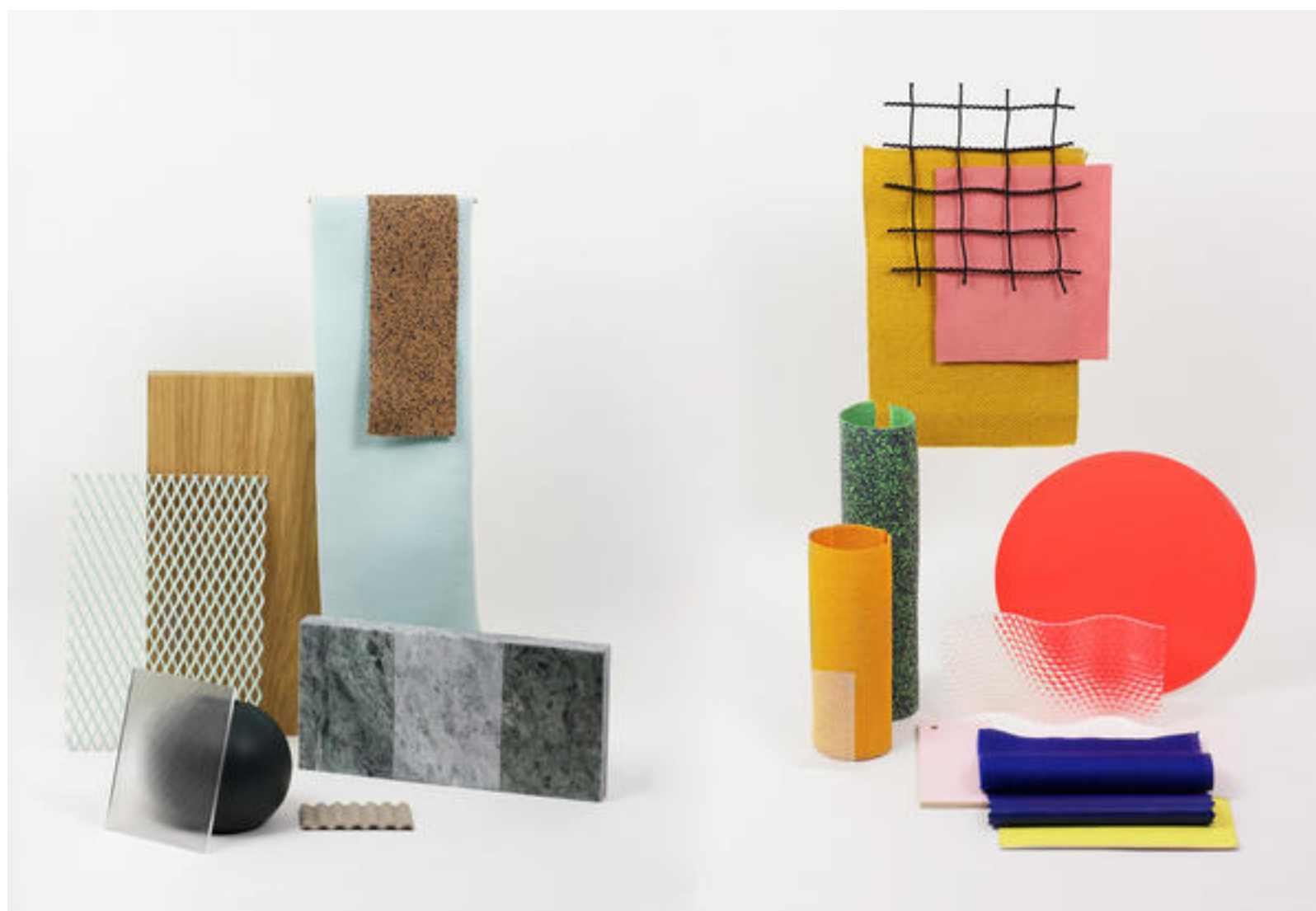
Foto: uno dei progetti premiati dal German Design Council in mostra all'Opificio

All'Opificio di via Tortona 31 tocca ai 21 prototipi, innovativi e pioneristici, dei designer premiati dal German Design Council, alle atmosfere da impressionismo francese dell'installazione Jardins d'Été di Davide Quayola, alla The Design Experience di Archiproducts e a un'originale show-car nata dall'incontro tra Citroën e Gufram.