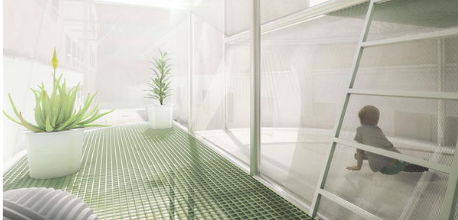
Foto: il MINI LIVING - Breathe in via Tortona 32