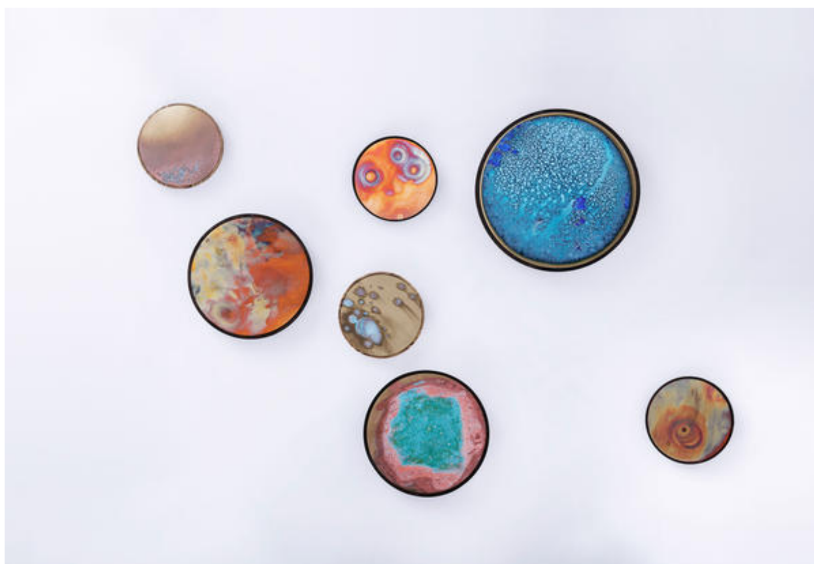
Foto: una delle opere dell'esposizione Rong in via Novi 5

Per i più allenati, la mostra Corian® Cabana Club al Padiglione Visconti di via Tortona 58 , un emozionante viaggio multiculturale nel mondo del massimalismo, e l'allestimento, curato da Domus, Milano Next, con le impressioni milanesi di Ronan Bouroullec, Maurizio Cattelan, David Chipperfield, Jasper Morrison, Studio Mumbai, Marcel Wanders e molti altri.