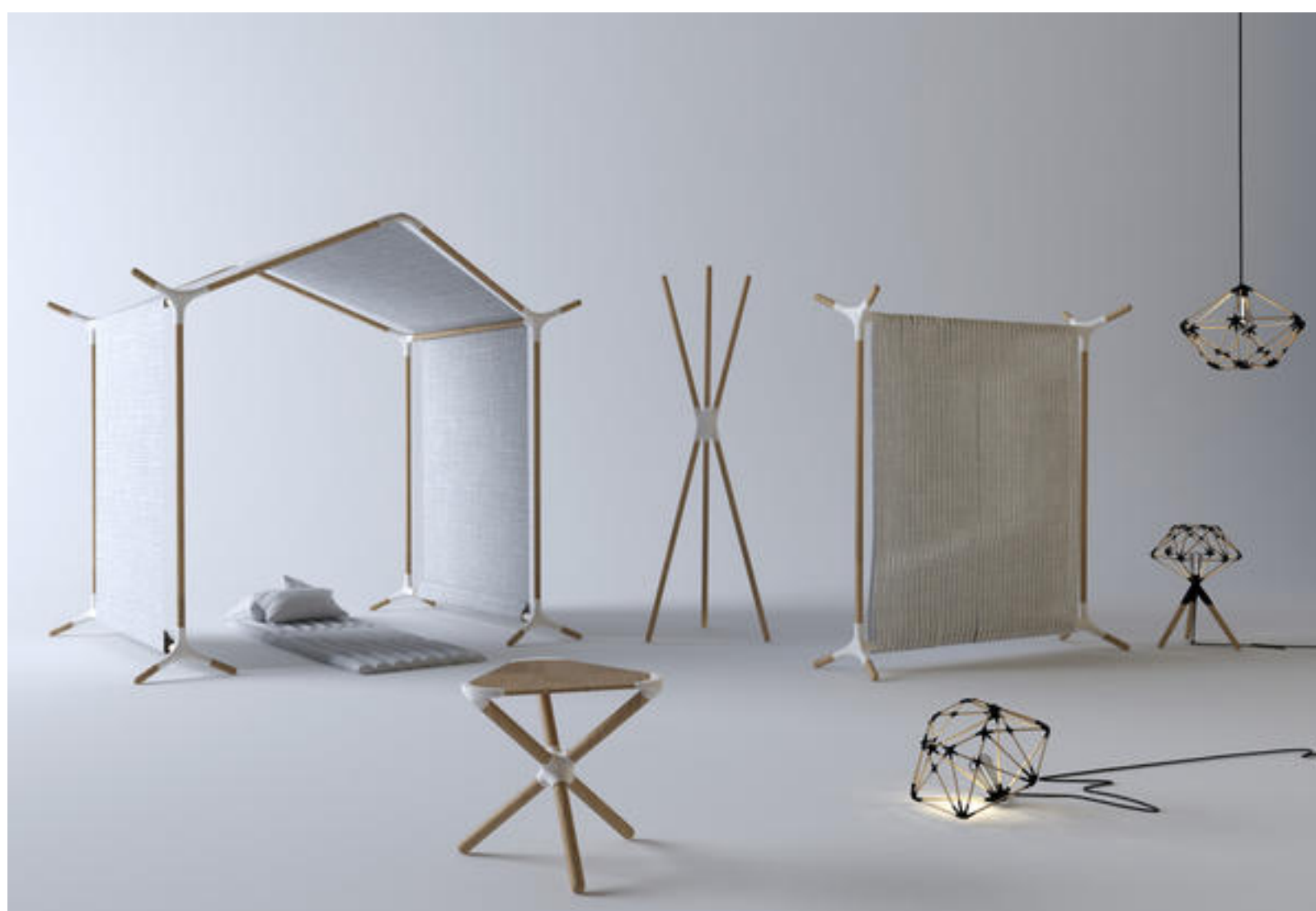
Foto: il progetto Hybridization di Libero-Rutilo al BASE per Design Nomade

LEGGI ANCHE → Lo spazio Ansaldo rinasce come officina creativa: BASE