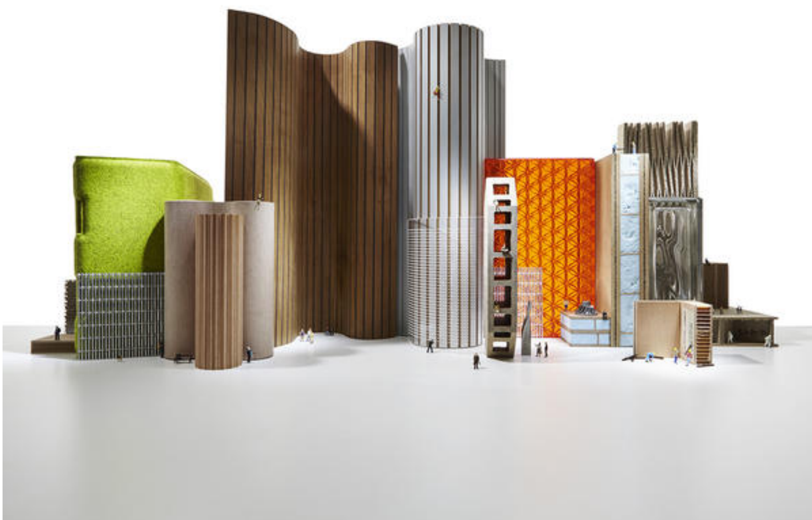
Foto: il Materials Village al Superstudio Più