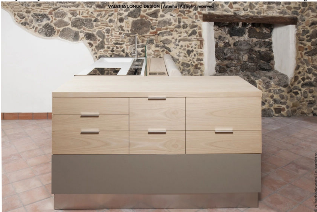
( https://spazioartema.com/2017/03/29/salina-arredo-multifunzionale/attachment/6/ )